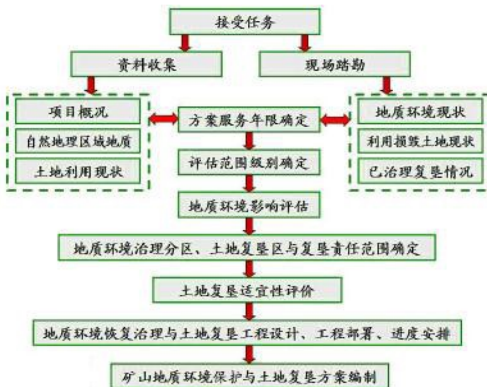
图 1 工作程序框图